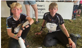
Klubbkompisarna pustar ut tillsammans